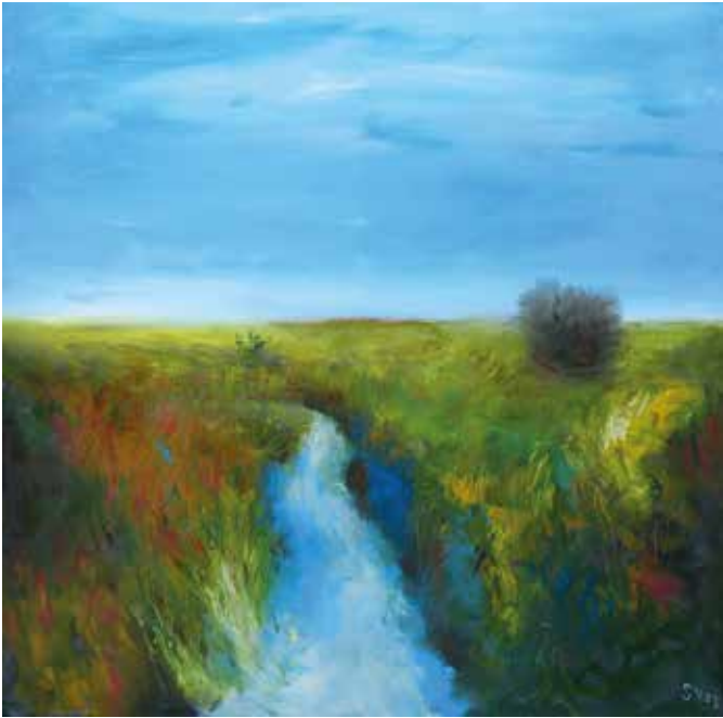
Bildtitel: Unendliche Weite 2023, Stefan Völker

Kunst im Rathaus ist zu einer beliebten Tradition geworden. Dieses Mal präsentieren in der Reihe RathausArt Stefan Völker (Malerei) und Joachim Brückner (Holzobjekte) ihr künstlerisches Schaffen und lassen ihre Werke im Atrium und in den Fluren in einen spannenden Dialog zur Architektur des Rathauses Schöneiche treten. Die öffentliche Vernissage findet am 14. März um 17.30 Uhr statt. Die Ausstellung kann bis 31. Juli 2024 zu den Öffnungszeiten des Rathauses besichtigt werden.